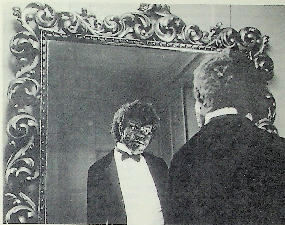
Yinka Shonibare: Dorian Gray, 12 delen, 2000

gens niet eens ben. Hegel is altijd pal blijven staan voor de mens als vrij wezen. Maar na lezing van het artikel van Buck-Morss kun je niet anders concluderen dan dat hij daar uiteindelijk de Europeaan mee op het oog had, en niet de Afrikaan.