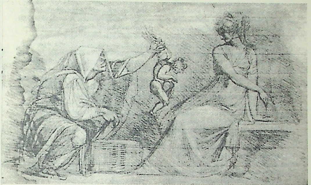
Fuseli, Cupido's te koop, ca 1775