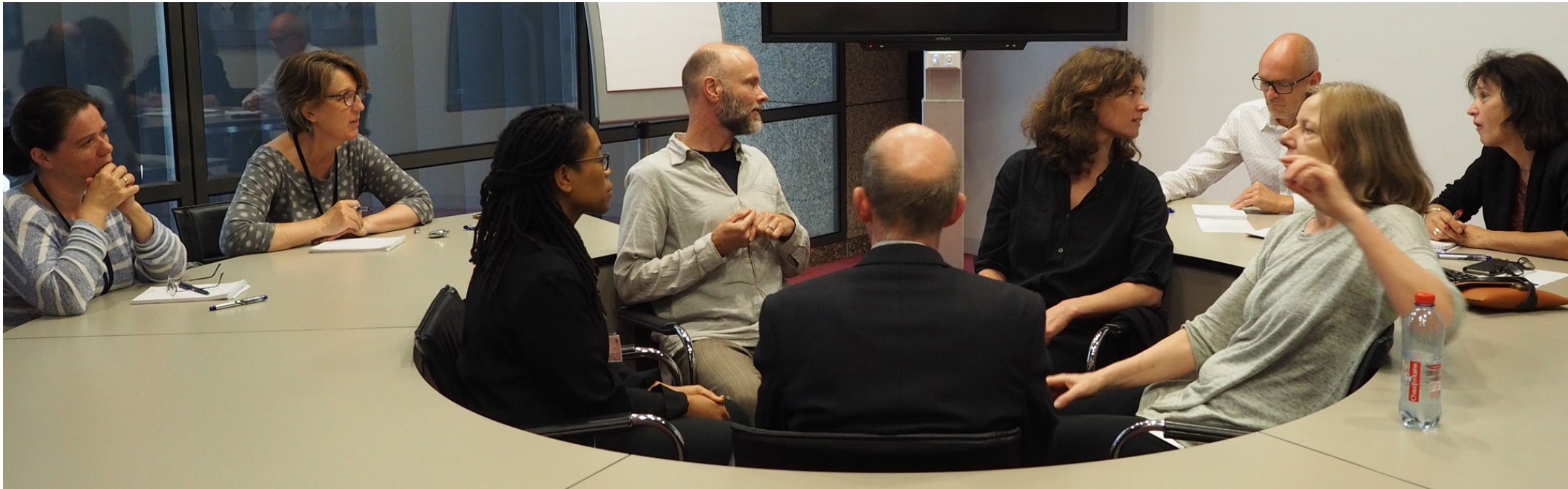
Onbekommerd spreken , Tweede Kamer der Staten-Generaal, 2016